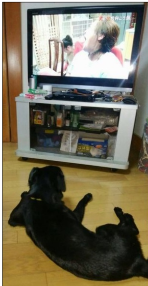
てガハハッと笑つとる：残念じゃが、あの笑い方は治らんねえ：」 by いっぱう君

ことが好きみたいで真面目に見てくれるそうです（笑） 「5年前：殺処分ギリギリのオレを助けてくれた茶色いオバチャン、テレビなのにあの時のまんま大口開けてガハハッと笑つとる：残念じゃが、あの笑い方は治らんねえ：」 by いっぱう君