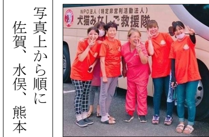
写真上から順に 佐賀、水俣、熊本